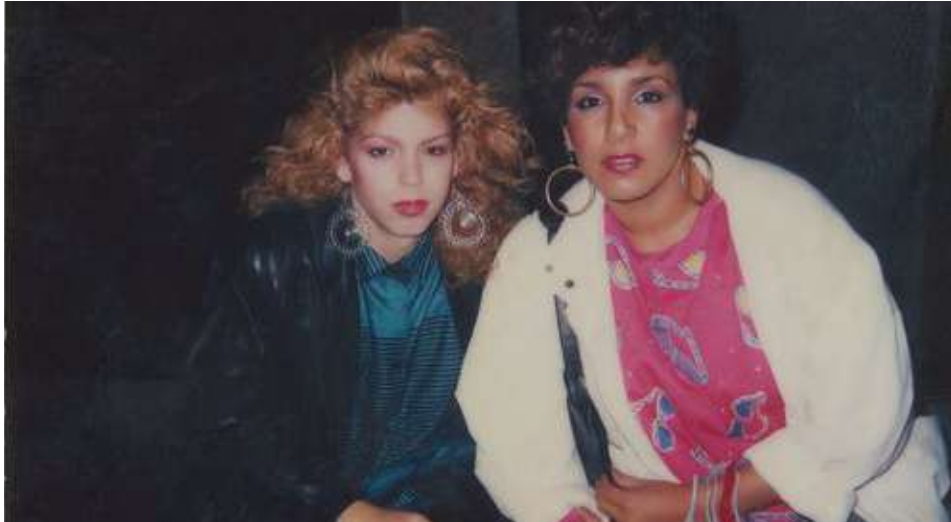
première suisse - en lice pour le Prix Mémoires LGBTQI+

85 min – doc. (2024) vo: ang – st: fr dès 14 ans