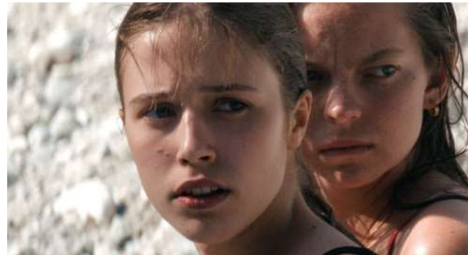
première suisse - en lice pour le Perfect Award prix du jury des jeunes

90 min – fiction (2025) vo: slo – st: fr dès 12 ans