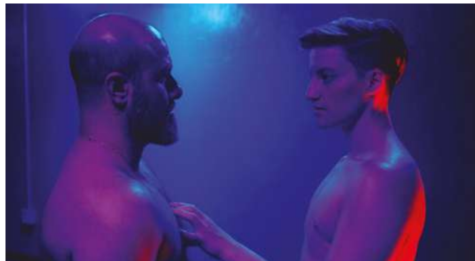
première suisse romande - en lice pour le Prix Mémoires LGBTQ+

83 min - docu-fiction (2024) vo: ang - st: fr dès 16 ans