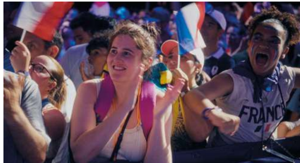
en lice pour le Perfect Award prix du jury des jeunes

77 min – fiction (2025) vo : fr dès 12 ans