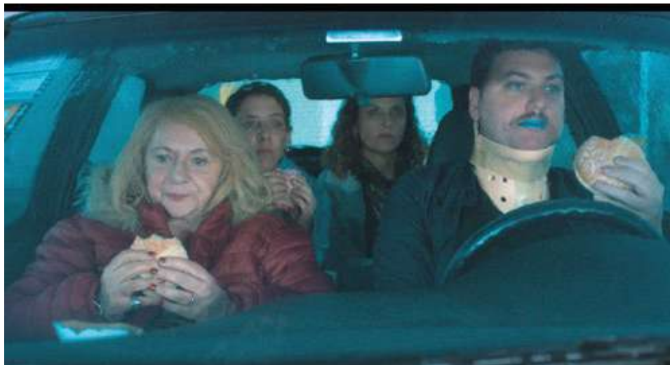
première suisse romande

78 min – fiction (2024) vo : esp – st : fr dès 14 ans