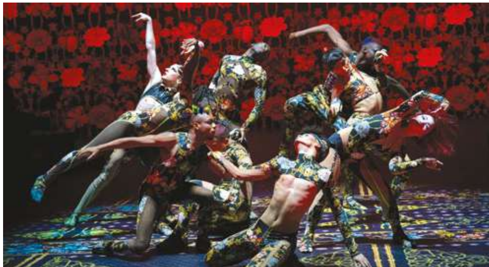
film de clôture - première suisse

99 min – doc. (2025) vo : ang – st : fr dès 14 ans