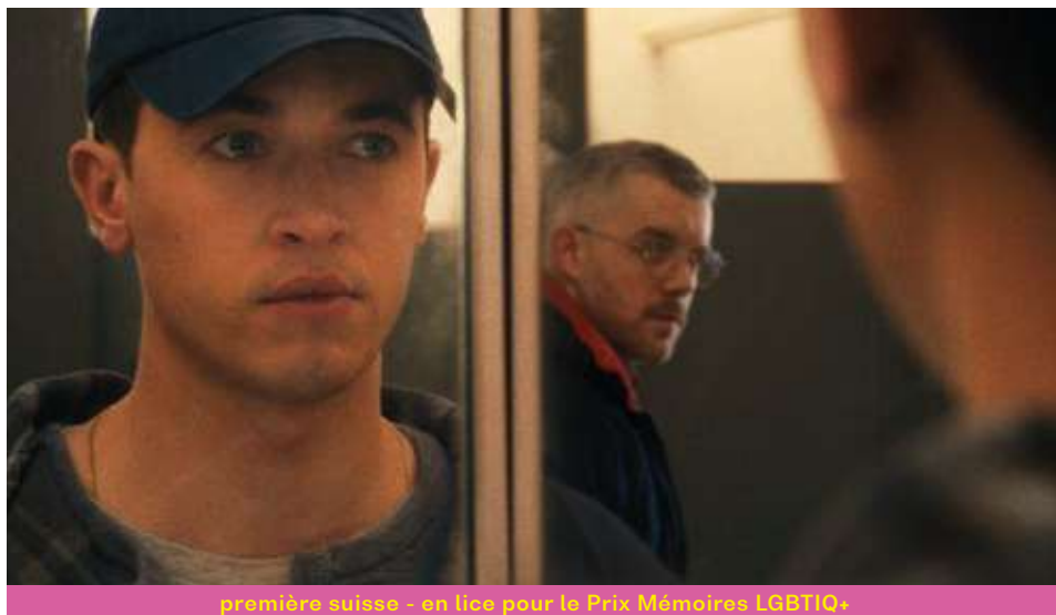
première suisse - en lice pour le Prix Mémoires LGBTQ+

95 min – fiction (2025) vo: ang – st: fr dès 16 ans