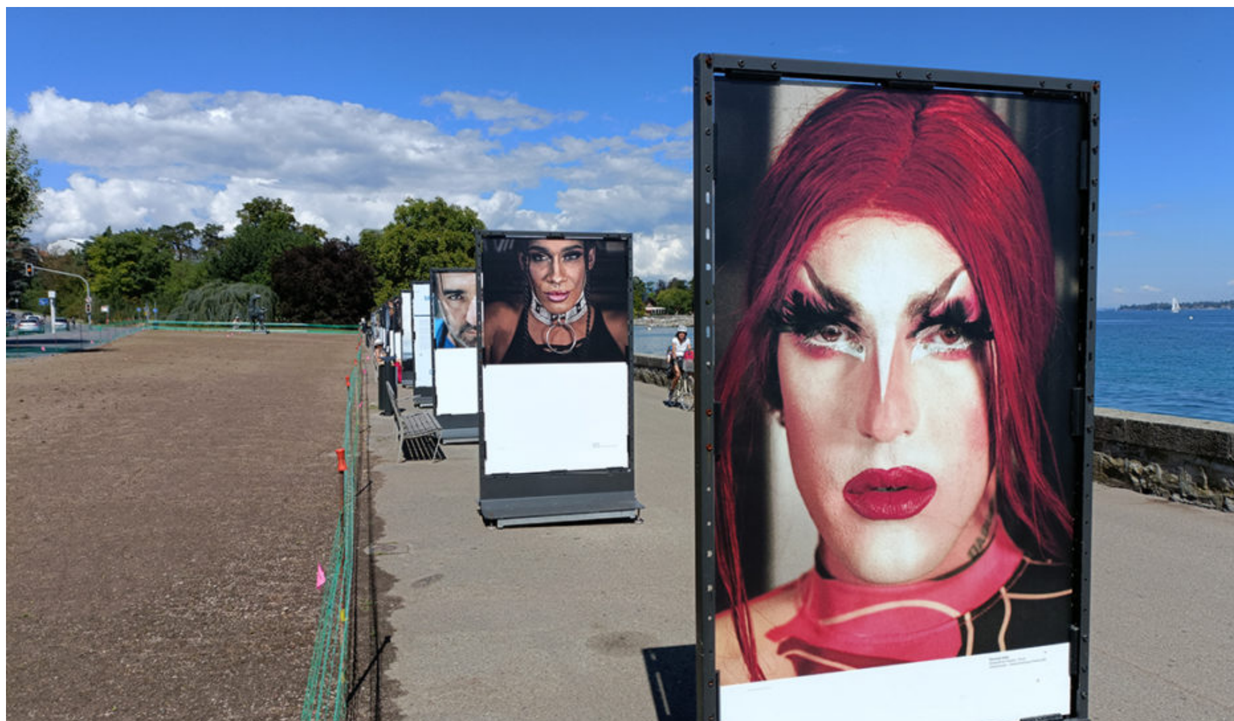
Une expo LGBTIQ+ d'une telle ampleur est une première en Suisse. RMR

DIMANCHE 4 SEPTEMBRE 2022 RODERIC MOUNIR